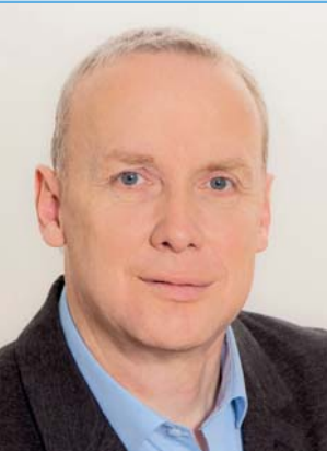
Ihr Bürgermeister / vaš župan Bernhard Sadovnik